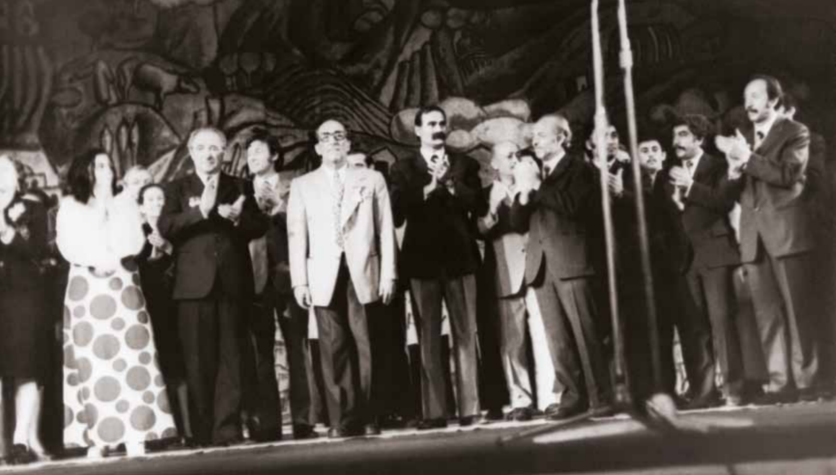
ტოვსტონოგოვის შამოქაველავითი საღაო