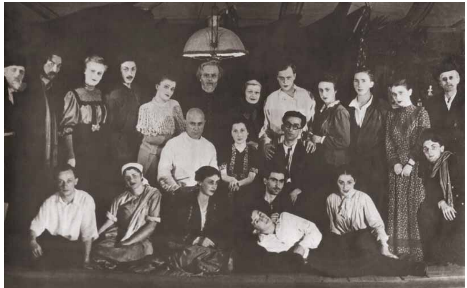
„მლაპირნი“ თეატრალური ინსტიტუტის სცენაზე

მერე იქვე, სახლთან ახლოს, კორტებზე გარბოდნენ და ჩოგბურთის ჩემპიონატებს აწყობდნენ, გოგას ყველგან თან დაჰყავდა – ასე გაჩნდა მათ შორის ის