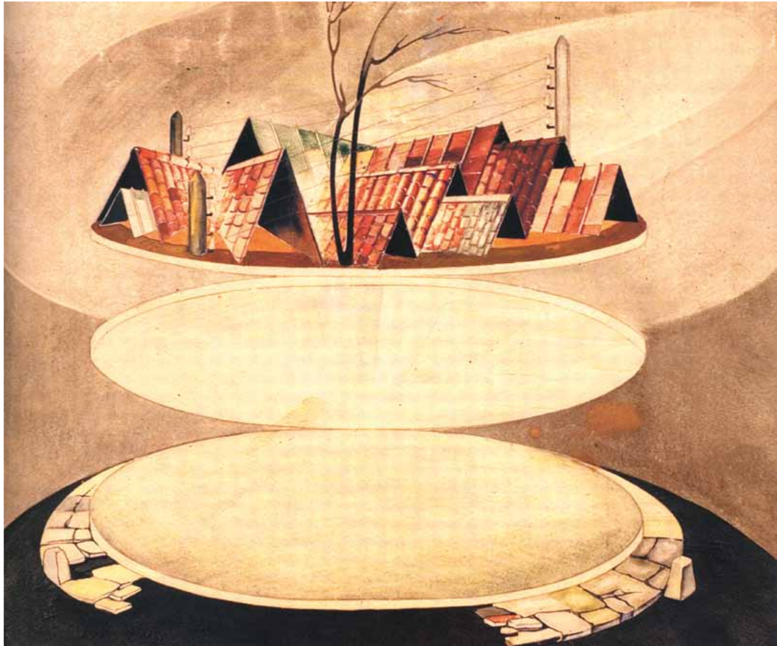
ისპიზი სპექტაკლისთვის „მუნჯები ალაპარაკდნენ“

მოიფიქრა, თუმცა, როგორც ყოველთვის – შესასრულებლად – რთული. ორი მრგვალი, დისკოსავით ბრტყელი წრე ერთმანეთზე მოათავსა, თანაც ისე, რომ ზედა სანახევროდ იწეოდა და ხან ქოხის სახურავად ევლინებოდა მაყურებელს და ხან კი