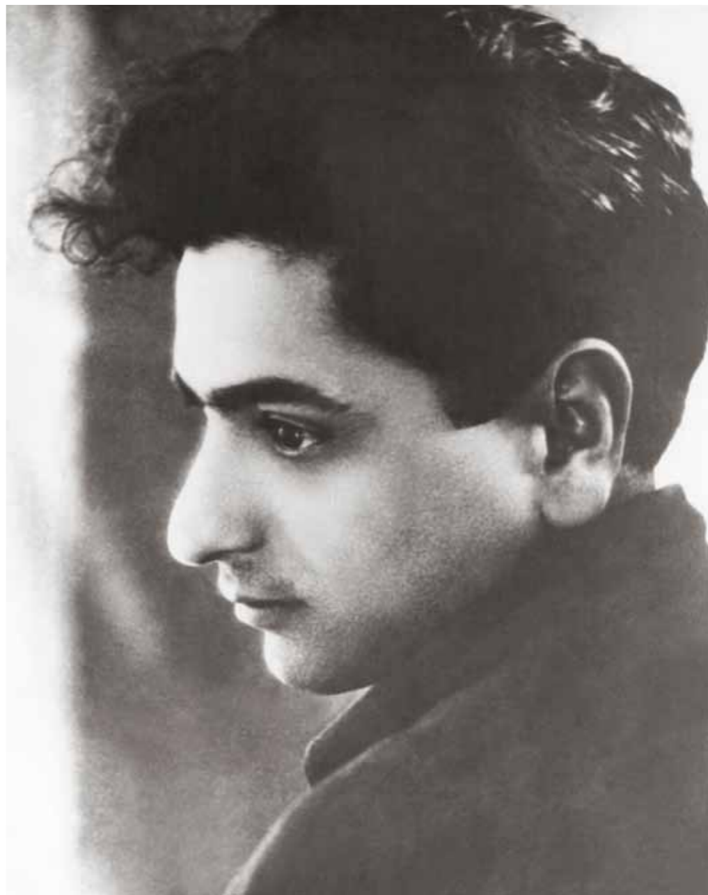
ორდერი №2008. ბრალდება: მოსკოვში „საქართველოს ნაციონალური ცენტრის“ მონაწილე, ეწეოდა ანტისაბჭოთა, კონტრრევოლუციურ-ტერორისტულ საქმიანობას.