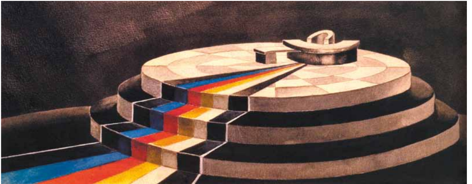
ასკიზი საექსპოზიციისთვის „მხანებელი სოლნესი“

1929 წლის 2 თებერვალს „ურიელ აკოსტას“ პრემიერამ უდიდესი ტრიუმფით ჩაიარა. პეტრე ოცხელის სახელი ყველას პირზე ეკერა, მისმა კოსტიუმებმა და დეკორაციამ პუბლიკა გააოცა. შემდეგ იყო პ. შელის „ბეატრიჩე ჩენჩი“, კ. კალაძის „ხატიჯე“, დ. შენგელაიას „თეთრები“... „ბეატრიჩე ჩენჩის“ ესკიზები თეატრში რომ მიიტანა, ბევრი სახტად დარჩა, იმდენად