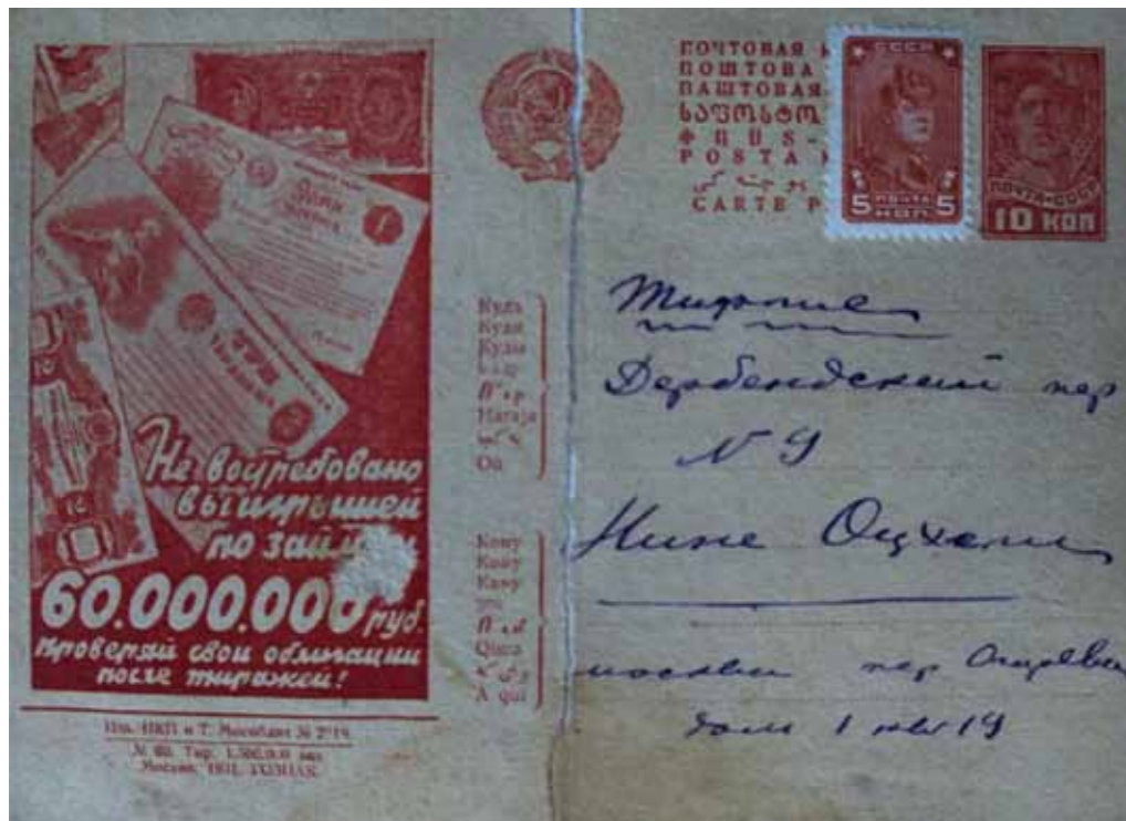
„ქვირვასო ნინკა, – წერდა დას მოსკოვიდან – რა თქმა უნდა, მაღანაშავე ვარ შენ წინაშე“

რომ სადღაც ამოვიკითხე პროფესორ მოროზოვის სტატია მარჯანიშვილის თეატრის შესახებ, სადაც ის წერს, რომ „ოცხელის არაჩვეულებრივი ნიჭიერებით შესრულებული ნამუშევრები არანაირ ჩარჩოში არ ჯდება. ჩვენ, ხელოვნების დარგის სპეციალისტები, ვერ ვახერხებთ ისინი დღეს არსებულ რომელიმე მიმდინარეობას ან ჟანრს მივაკუთვნოთ, რადგანაც ეს ნამუშევრები უაღრესად ახლები და სპეციფიკურია.“ შენ კი ფორმალისტად შემრაცხე... წერილობით არც ვაპირებ შენთვის ლექციების კითხვას. თანაც, თუკი ოდესმე ვინმე წაიკითხავს ამ წერილს, ისეთი შთაბეჭდილება დარჩება, თითქოს ჩემი თავი დიდი ვინმე მგონია. იმას კი არ იფიქრებენ, რომ შენ-ნაირმა მაცდურმა გამომიწვია პაექრობაში. გკოცნი. შენი პეტია.“